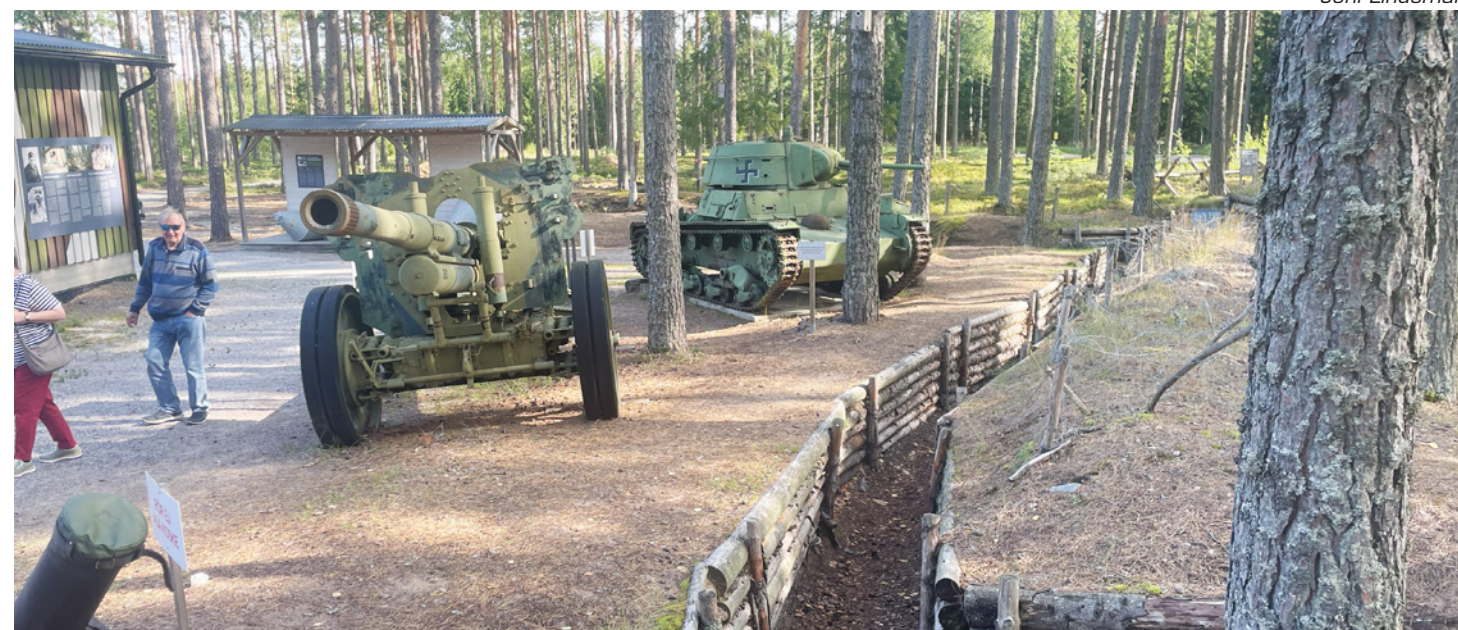
Hangon rintamamuseo on siitä harvinaisen suomalainen sotamuseo, että se sijaitsee aidolla tapahtumapaikallaan.