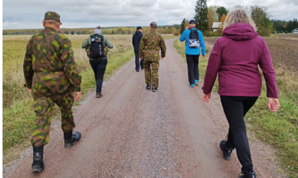
Tummat pilvet onneksi vain ukhailivat suurimman osan matkaa.

viläistoiminta on kaikille ikään, sukupuoleen tai välimatkoihin katsomatta. Yhtenä porukkana pidimme reipasta vauhtia yllä, etenkin marssin viimeisen kilometrin aikana, jolloin taivas repesi ja saimme kunnan vesisateen kirittämään loppumatkaa. Heikinpirtillä oli onneksi makkarat grillattuna ja sauna kuumana. Kun huolto pelaa, ei syysateetkaan haittaa. Ja toki tämä yhteislähtö oli vain yksi päivä, kaikki ovat tietenkin marssineet koko kuun ahkerasti kukin tahoillaan.