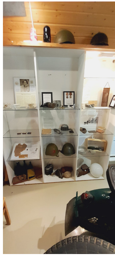
Igor-museossa sukelletaan Porkkalan vuokra-alueen vaiheisiin.