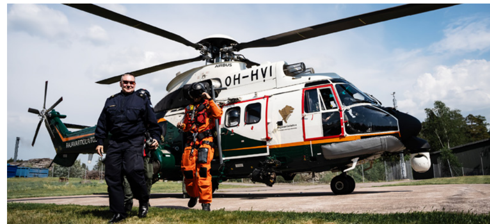
Maihin palattiin helikopterikyödyillä.