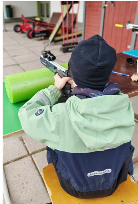
Ekoammunta on rasti kilpailujen hitti myös perheen pienimpien mielestä.

Kuluvan vuoden 2024 toimintasuunnitelmaa laadittaessa todettiin, että tietyille sääntömuutoksille on jälleen tarvetta ja