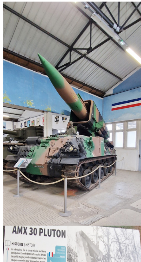
AMX 30 Pluton oli varustettavissa taktisella ydinkärjellä.

Kaikesta huomasin, että museota on rakennettu ajatuksella ja harkitun, joten lopputulos varmasti tyydyttää vaativaakin museokävijää. Museossa on myös melko laaja ja kattava museokauppa, josta voi hankkia monenlaisia muistoesineitä ja kirjallisuutta kotiin. Matkaa Saumurin keskustasta muse-