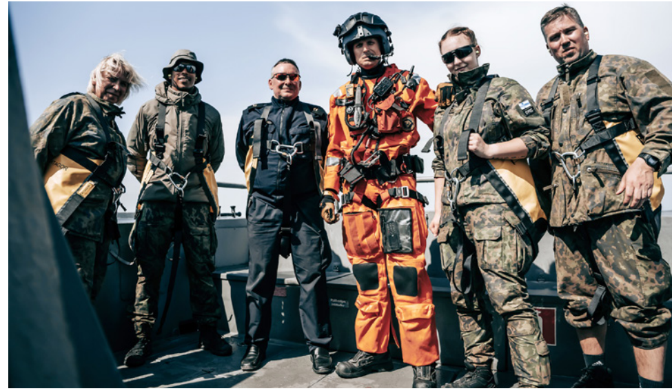
Toiminnallinen kurssiviikonloppu sai hymyn kasvoille.