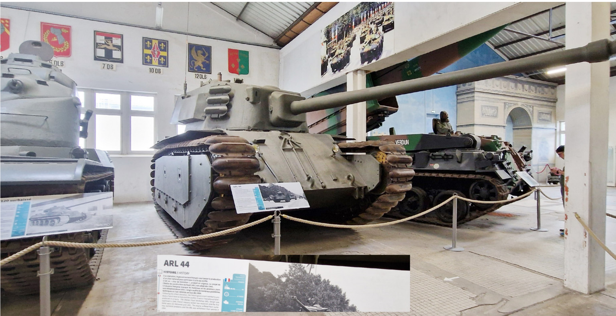
ARL 44 -panssarivaunu on yksi museon suurista harvinaisuuksista.