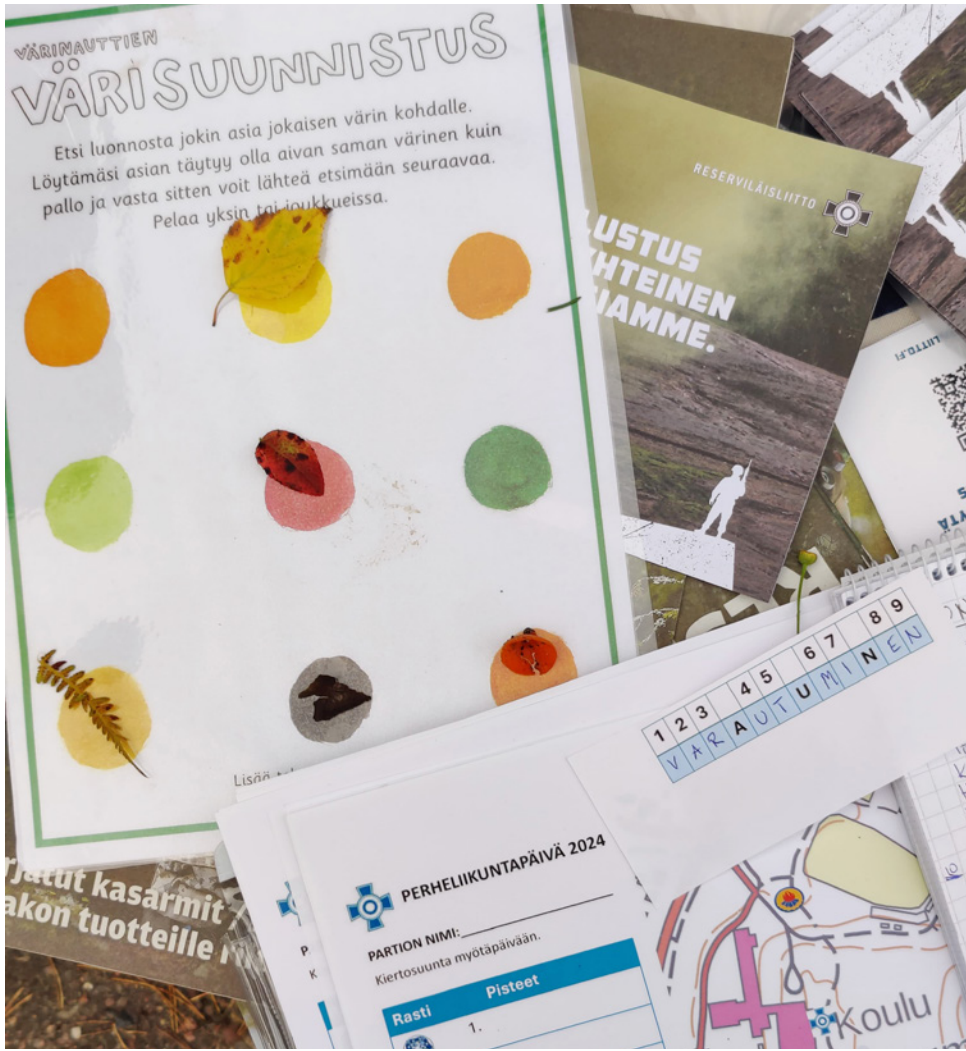
Ensimmäiset matkatehtävät arvioitavana, kilpailukortit valmiina seuraaville partiolle.