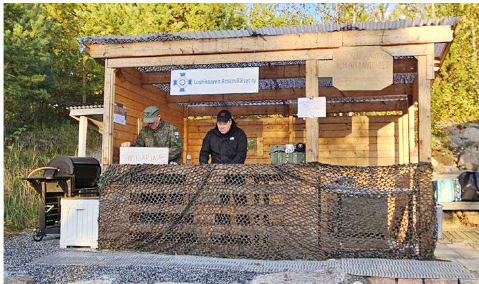
Marssin tukikohtana toimi tuttuun tapaan Saunaparoni.

Vesi- ja välipalapeiteitä oli kolme, joista kaksi lyhyemmän reitin varrella. Niistä löytyi nesteytystä, lisäenergiaa, rakkolaastareita sekä henkistä tukea marssijoille. Opastei-