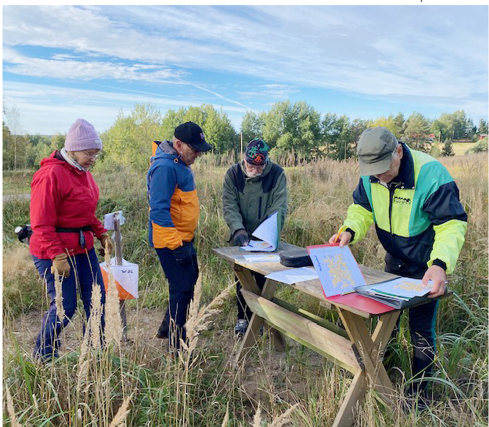
Monipuoliset rastit panivat avonystyrät hommiin.

Yleensä toiminnan haasteena tänä päivänä on saada enemmän osallistujia kuin rastihenkilökuntaa. Yhdistämällä eri yhdistyksien voimavarat sekä kutsumalla tilaisuuteen laajasti useita Salon alueen maanpuolustusyhdistyksiä