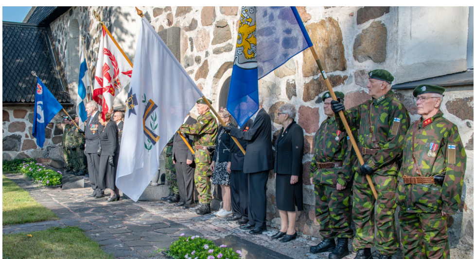
Kunnioitettiin Raision sankarihaudalla.