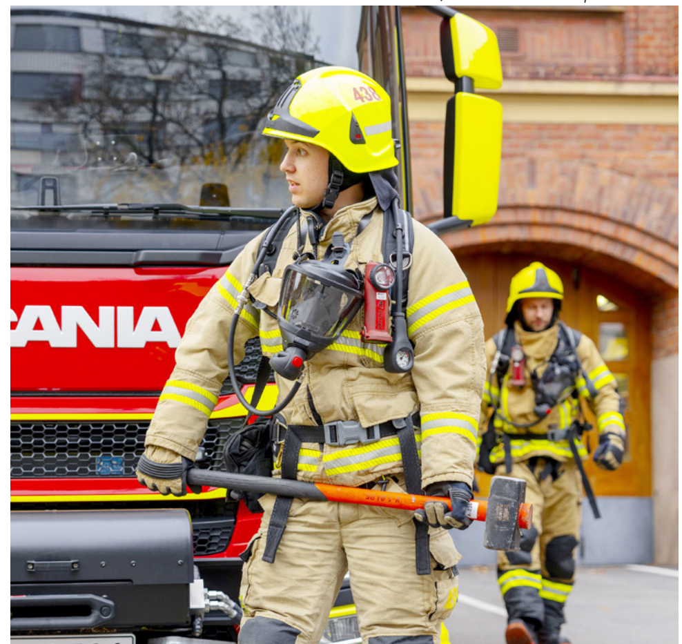
Pelastajan työssä pitää olla valmis kohtaamaan odottamattomiakin tilanteita.

Kristian Elaluoto / Varsinais-Suomen pelastuslaitos