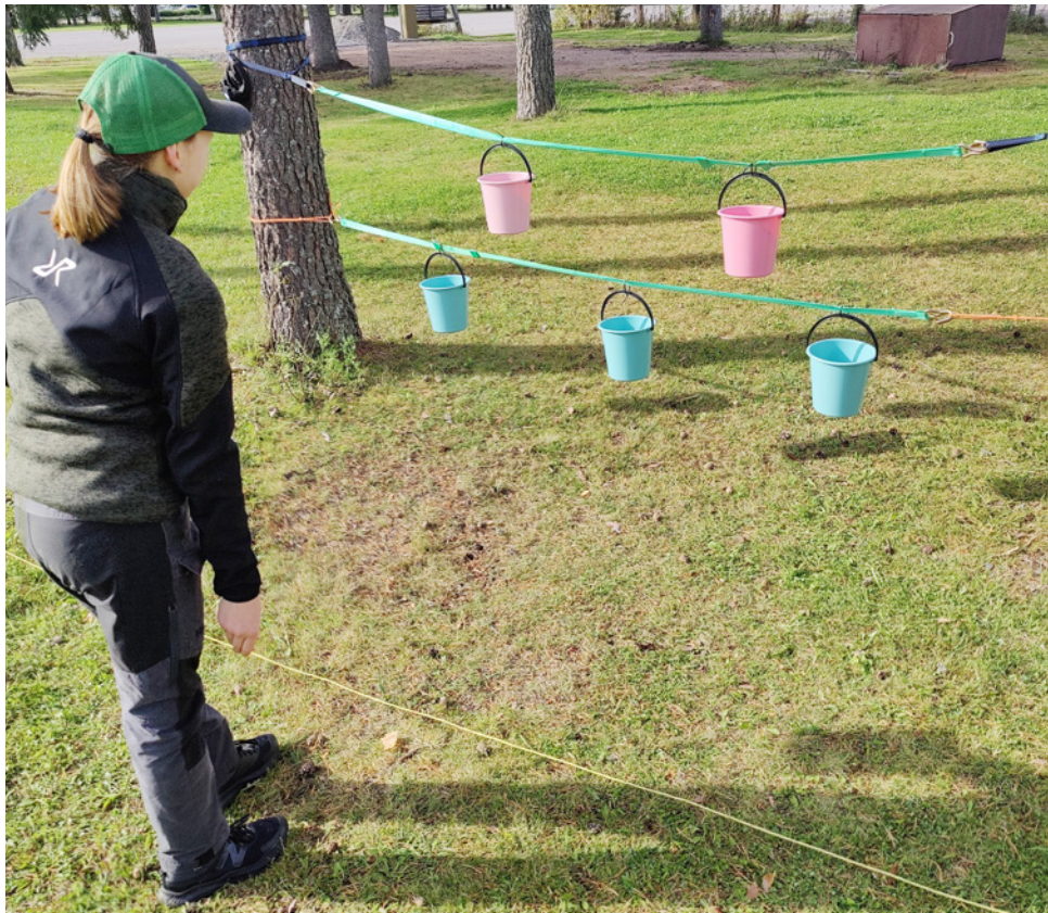
Tarkkuusheiton maaleina ämpärisarja.

Nämä 15 vuotta ovat tuoneet ikimuistoisia hetkiä mutta joskus vaan aika ajaa tapahtumien ohji ja on hyvä jättää ne taakse.