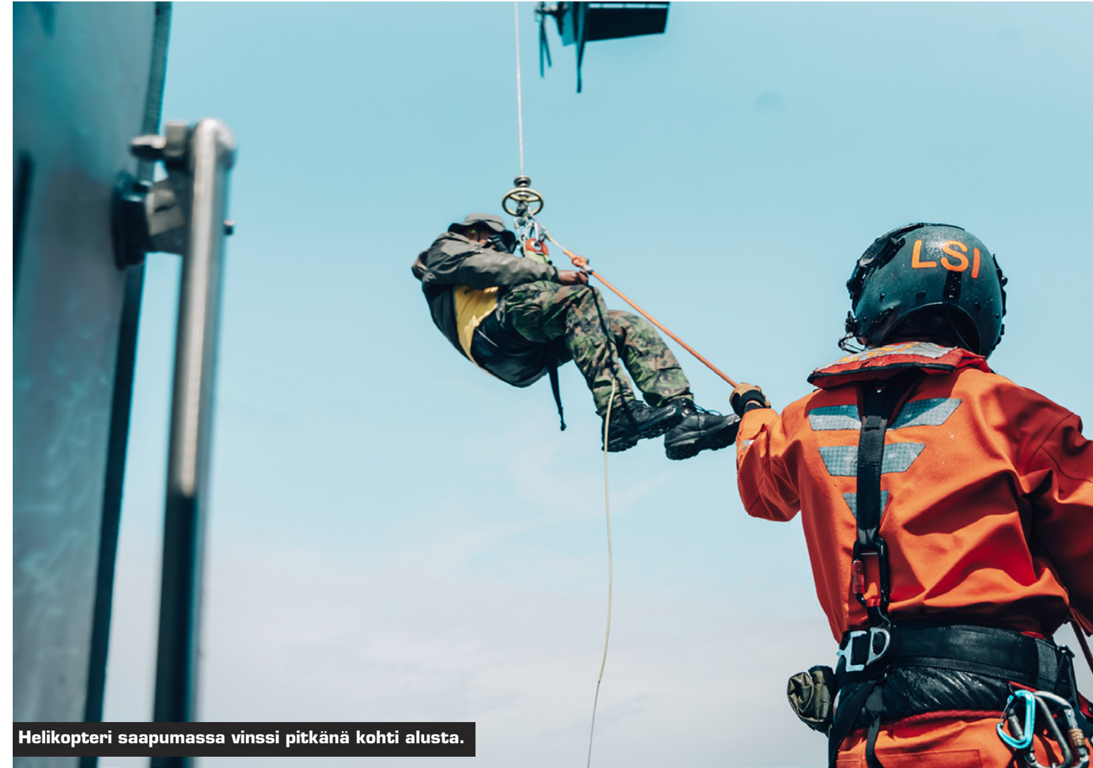
Helikopteri saapumassa vinski pitkänä kohti alusta.